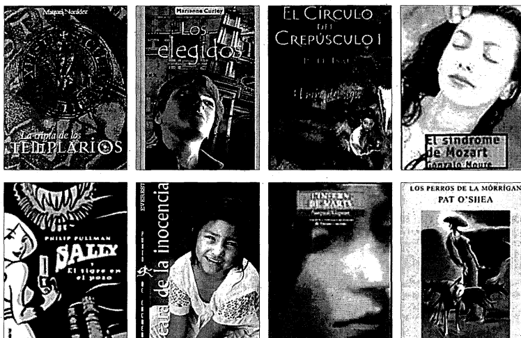
► Las tramas de aventura, novela policíaca, terror, ciencia ficción y novela fantástica e histórica predominan en la abundante oferta literaria para este prometedor verano